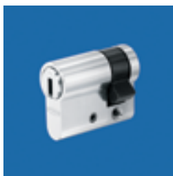
Art. Nr. 21.714 Profil-Halbzylinder aus SIDRA-Metall.