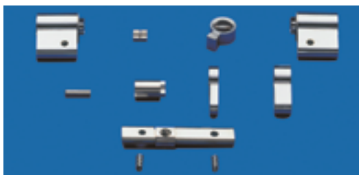
Das Baukastensystem von KESO10RS. Bestehend aus Gehäuseverlängerungen, Schlüsselverlängerung, Zylinderkernverlängerung und Verbindungssteg.