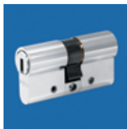
Art. Nr. 21.715 Profil-Doppelzylinder aus SIDRA-Metall. Art. Nr. 21.719 mit Drehknäuf